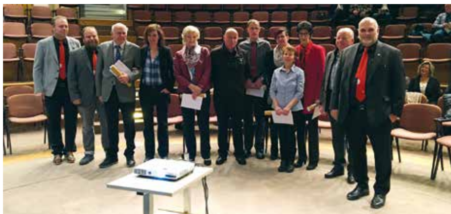
Das Gastrovalais-Komitee posiert mit den Jubilaren, 50, 40 und 20 Jahre Tätigkeit.

Mit der Hilfe von zwei Abgeordneten haben wir im Grossen Rat eine Interpellation über die Beihilfen bei der