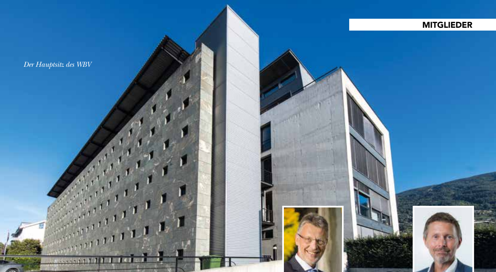
Der Hauptsitz des WBV