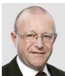
Jean-Luc Addor SVP