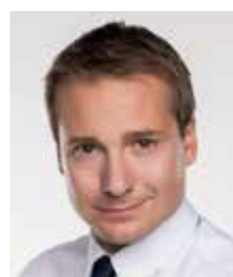
Philippe Nantermod FDP